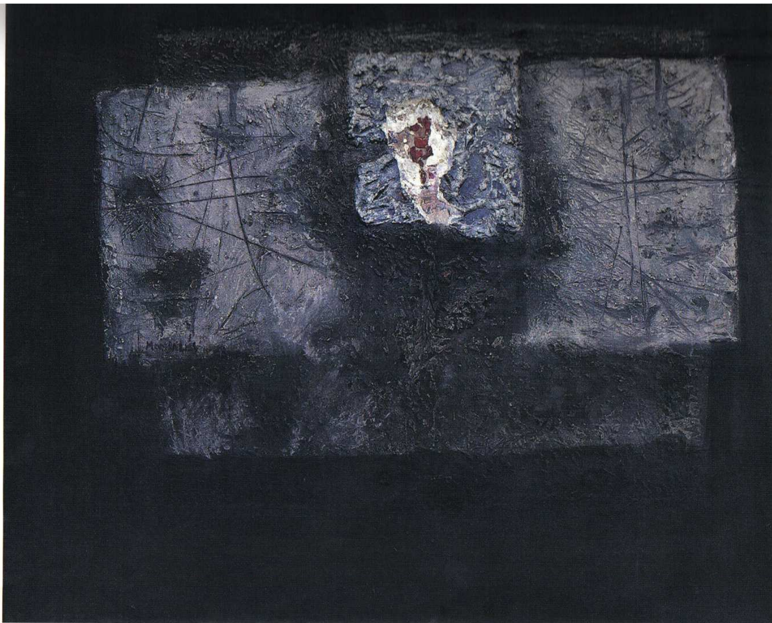
MONJALÉS Epitafio para un poeta , 1960 Técnica mixta sobre tela 114 x 146 cm Colección particular